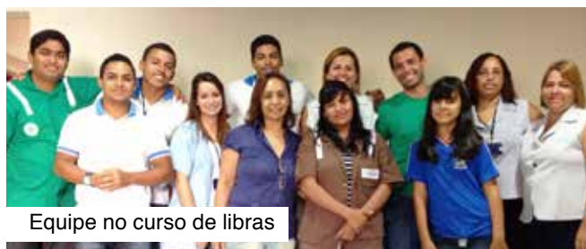
Equipe no curso de libras

A Viação Nossa Senhora do Amparo está ministrando curso de Linguagem Brasileira de Sinais (Libras) para seus funcionários. Os participantes aprendem técnicas de atendimento ao deficiente auditivo, legislação sobre acessibilidade, formas de comunicação, alfabeto, números, cumprimentos e vocabulário de convivência. Entender Libras é importante para que os funcionários possam interagir, não somente com o colega surdo, mas também com o passageiro não ouvinte. Hoje, os surdos estão totalmente inseridos nos ambientes acadêmicos, profissionais e em toda a sociedade.