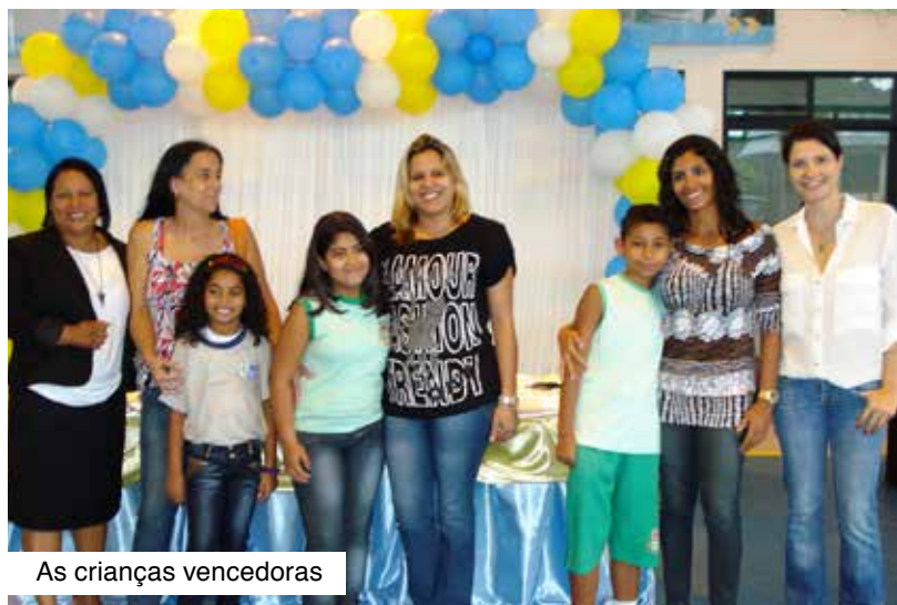
As crianças vencedoras

A Viação Nossa Senhora do Amparo recebeu, em sua garagem de Rio do Ouro, entre os dias 22 e 30 de outubro, crianças matriculadas no 4º ano do ensino fundamental de escolas públicas de São Gonçalo e Niterói. As visitas fazem parte do projeto "Amparo Vai à Sua Escola", que, pelo 5º ano consecutivo, oferece cultura e entretenimento a alunos da região onde os ônibus da Viação circulam. Sempre com um viés educativo, este ano o tema do projeto foi "CUIDADO NO CAMINHO". Os estudantes receberam informações sobre como se proteger nas ruas e nos transportes, e foram estimulados a pensar sobre o assunto através de uma peça de teatro. Nas visitas, os jovens foram convidados a participar do concurso de redação com tema sobre segurança e souberam como a empresa faz a manutenção de seus ônibus e treina