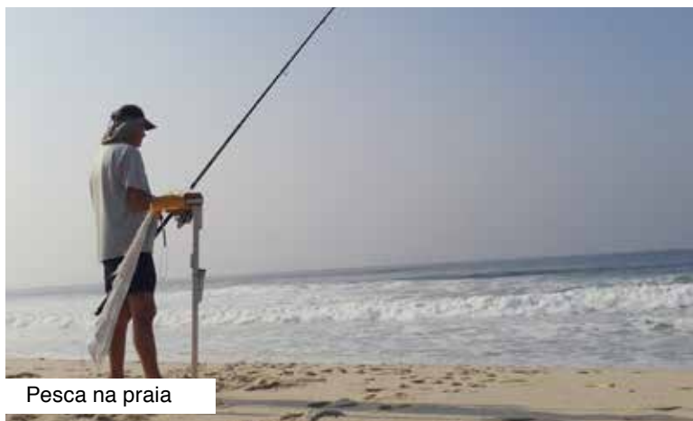
Pesca na praia

43 km de praias, 5 lagoas, belas serras, cachoeiras cristalinas, grutas e áreas cultural e rural, tudo isso com direito à prática de esportes radicais. Onde? Pertinho do Rio, em Maricá. Se você mora ou frequenta Maricá, explore o local, pois atrativos não faltam. Com sua geografia privilegiada, o município oferece passeios recheados de aventura para praticantes de vôo-livre, surf, windsurf, montanhismo, escaladas, jeep cross, moto cross, trilhas e caminhadas. E, para quem prefere a calma da pescaria, a região oferece locais paradisíacos. Com 128 mil habitantes, Maricá conta com os distritos de Ponta Negra, Inoã e Itaipuaçu, todos recebendo cada vez mais moradores fixos vindos das cidades grandes. Muitos chegam como turistas, viram frequentadores e acabam ficando de vez. Valorize e aproveite Maricá! <