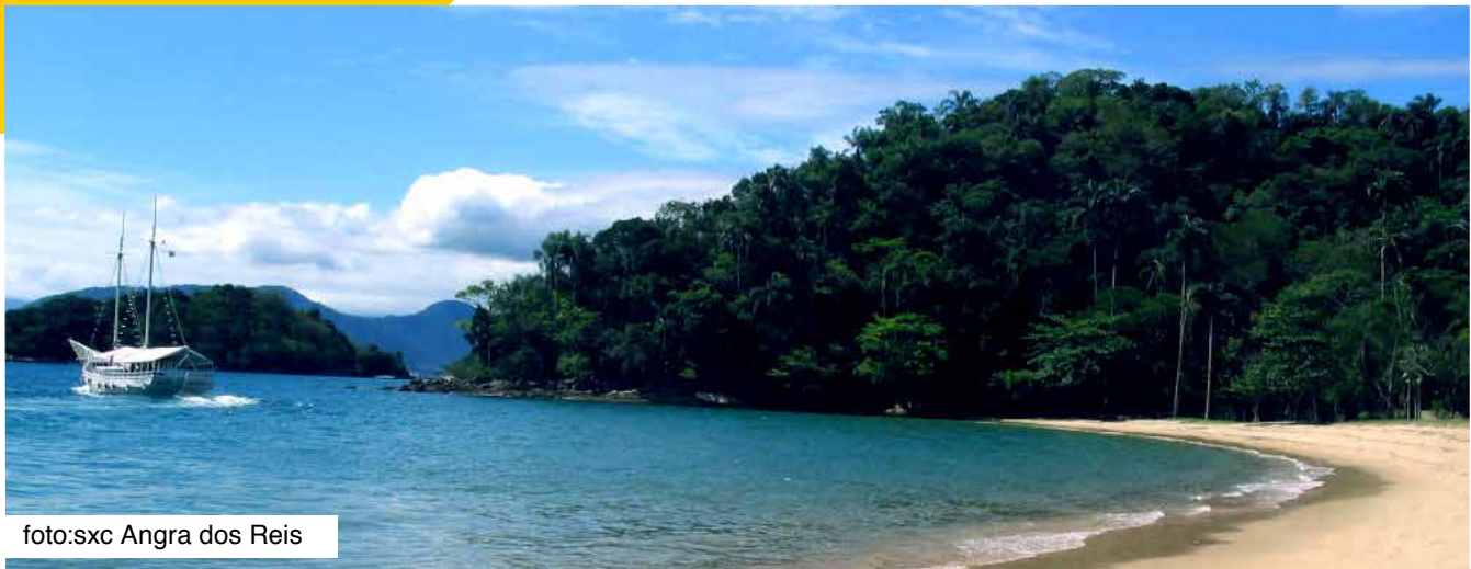
Angra dos Reis

Em novembro começou a alta temporada de excursões realizadas pela Viação Nossa Senhora de Amparo. E, para atender ainda melhor, a empresa comprou mais ônibus novos e modernos, com ar condicionado e bancos reclináveis. “Já começamos a nos agendar para as viagens de verão, quando a procura para excursões para Angra dos Reis, Parati, Marataízes e Cachoeiras de Macacu é