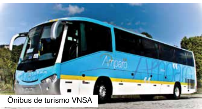
Ônibus de turismo VNSA

Amparo. Os ônibus da empresa tem autorização para circular em todas as estradas que rodeiam os estados do Rio de Janeiro, São Paulo, Minas Gerais e Espírito Santo. ◀