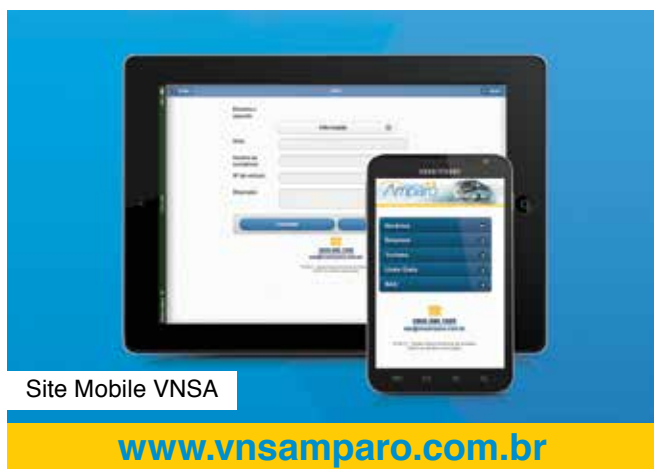
Site Mobile VNSA