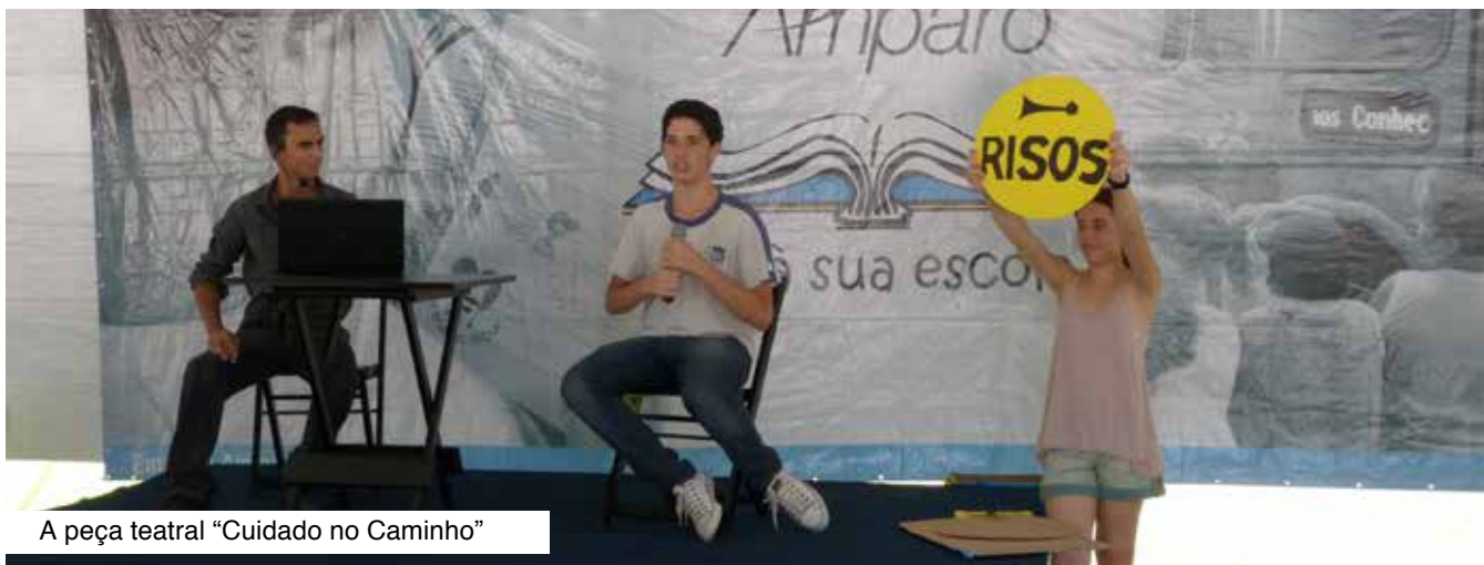
A peça teatral "Cuidado no Caminho"

A Viação Nossa Senhora do Amparo recebeu, em sua garagem de Rio do Ouro, entre os dias 22 e 30 de outubro, crianças matriculadas no 4º ano do ensino fundamental de escolas públicas de São Gonçalo e Niterói. As visitas fazem parte do projeto "Amparo Vai à Sua Escola", que, pelo 5º ano consecutivo, oferece cultura e entretenimento a alunos da região onde os ônibus da Viação circulam. Sempre com um viés educativo, este ano o tema do projeto foi "CUIDADO NO CAMINHO". Os estudantes receberam informações sobre como se proteger nas ruas e nos transportes, e foram estimulados a pensar sobre o assunto através de uma peça de teatro. Nas visitas, os jovens foram convidados a participar do concurso de redação com tema sobre segurança e souberam como a empresa faz a manutenção de seus ônibus e treina